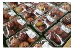
シナノルチェ、つがる、など